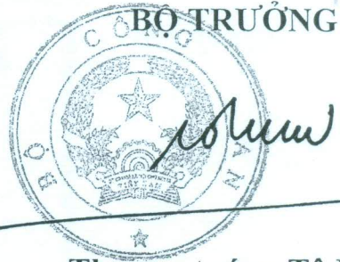
Thượng tướng Tô Lâm